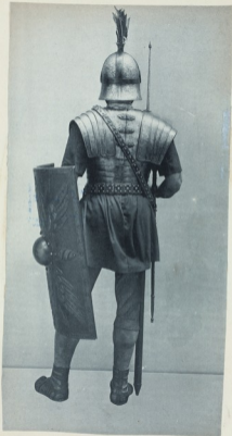
VIRRHUIZEN COLLECTION DRAPER FUND