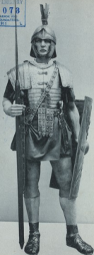
VINKHUIZEN COLLECTION DRAPER FUND

THE NEW PUBLIC LIBRARY 571078 ASTOR, LENOX AND TILDEN FOUNDATION 1911