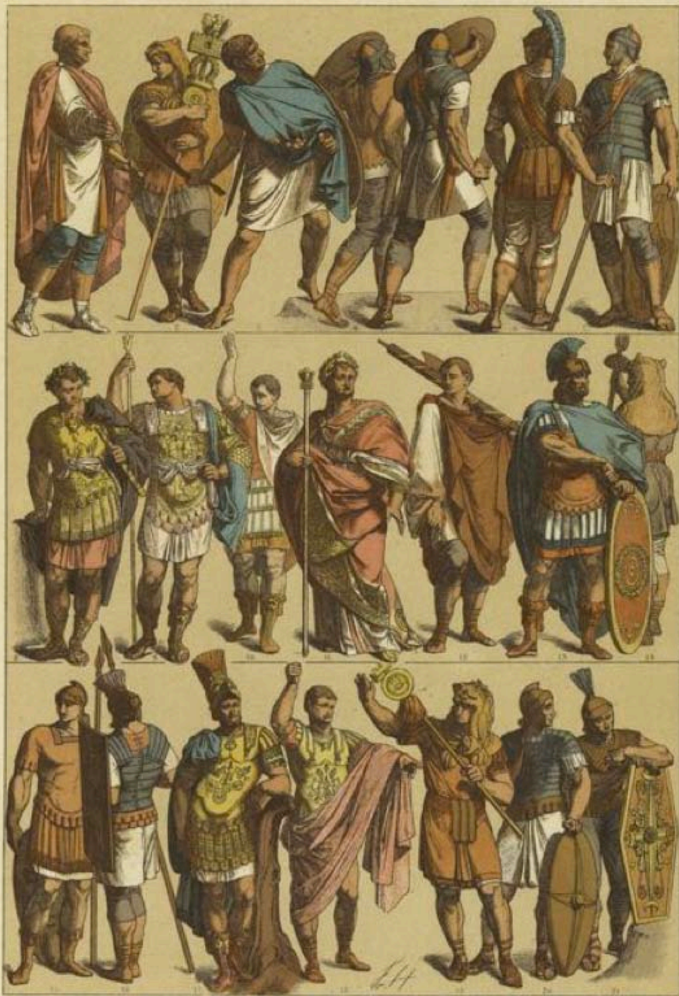
EDAD ANTIGUA.—TRAJES Y EMBLEMAS DE LOS ROMANOS