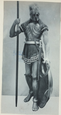
VINKHUIZEN COLLECTION DRAPER FUND