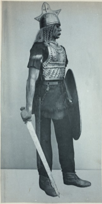
VINKHUIZEN COLLECTION DRAPER FUND