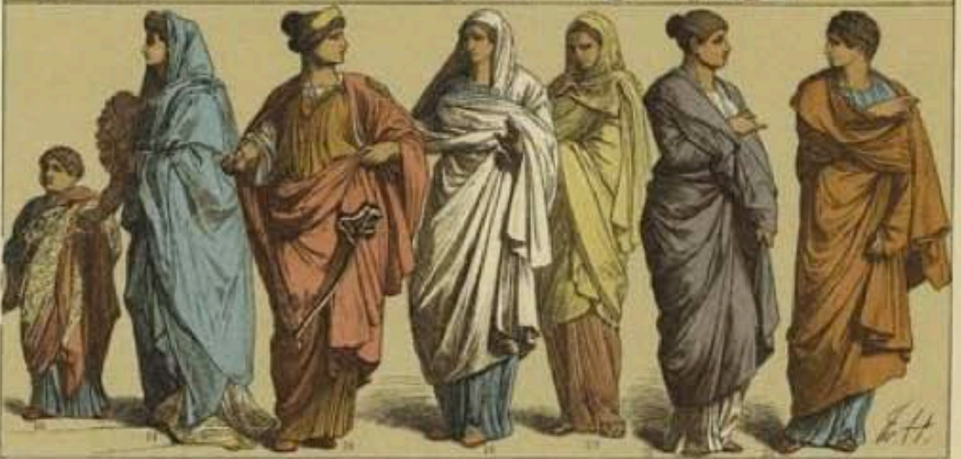
EDAD ANTIGUA.—CASCO Y OBJETOS DE ADORNO ETRUSCOS Y TRAJES FEMENILES DE LA ÉPOCA ROMANA