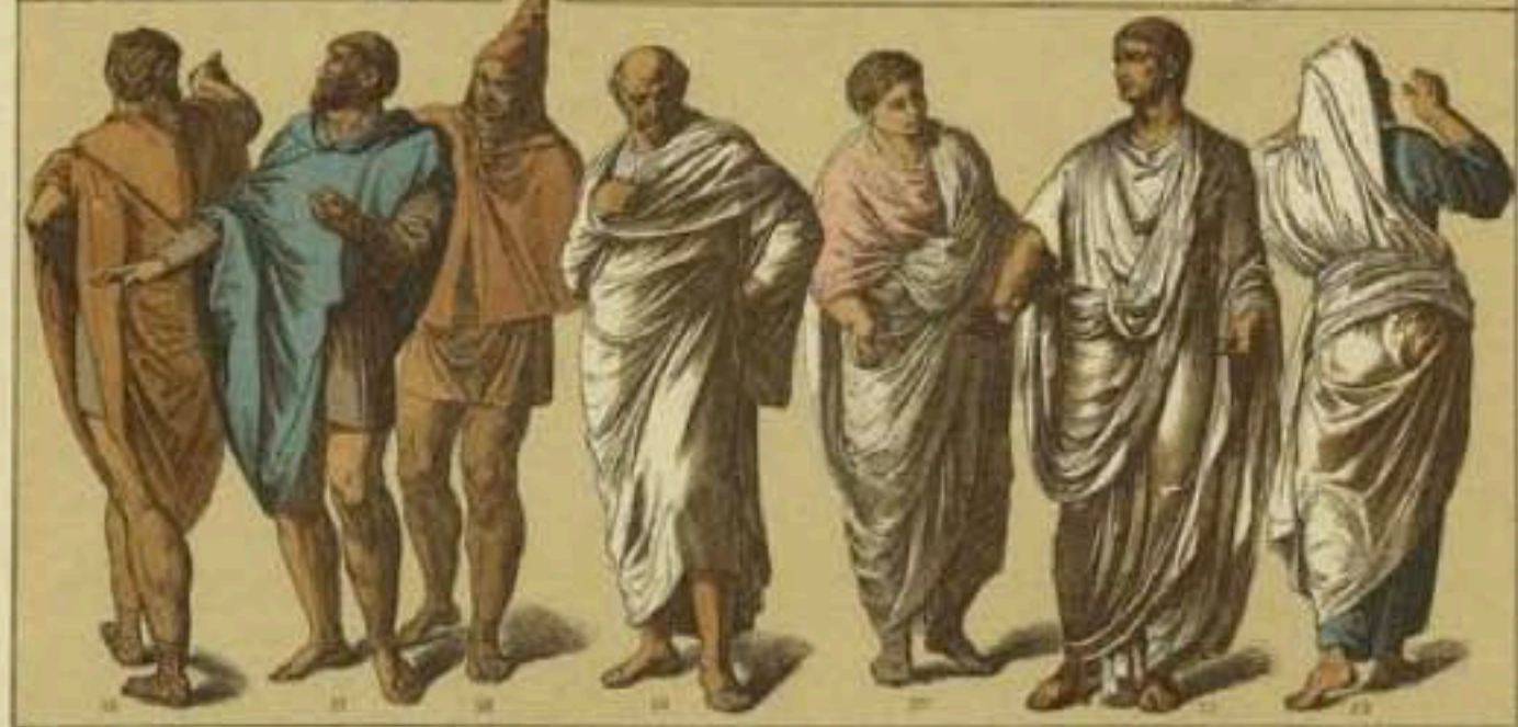
EDAD ANTIGUA.—TRAJES DE LOS ROMANOS